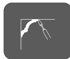
liekās līmes noņemšana